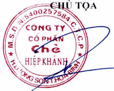
ĐẶNG THẾ PHI